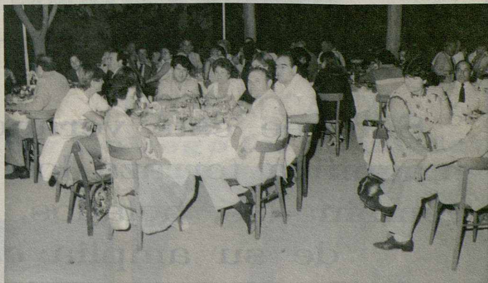
Vista general del aspecto que presentaban los jardines del restaurante La Masia.