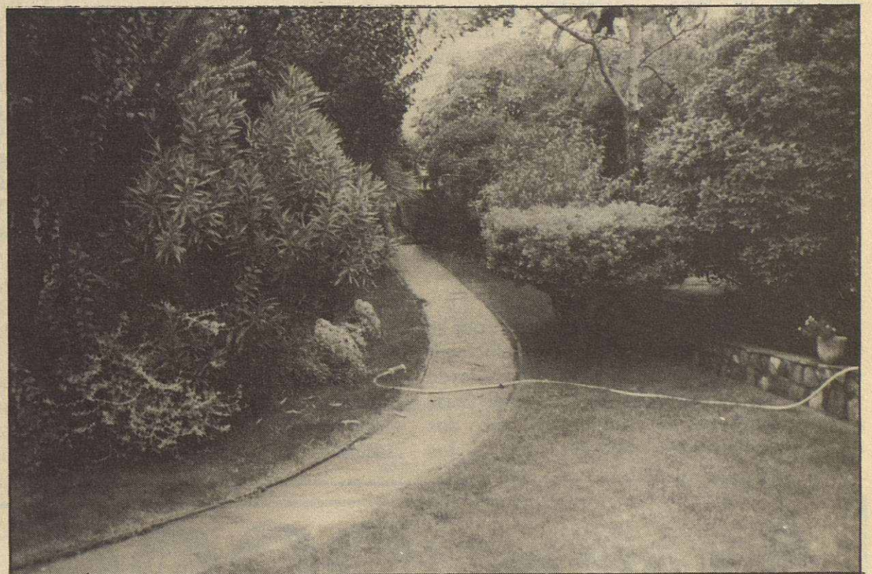
Aspecte del jardí exterior de Les Moreres durant la primavera

Disposem d'amples habitacions amb bany, individuals o compartides, d'una gran sala d'esbarjo amb televisió, galeria coberta... i d'un extens jardí de 1.300 metres amb piscina, on podreu descansar, passejar, gaudir de la lectura o bé practicar la jardineria.