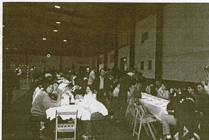
La festa començà amb un gran sopar.

podia assistir-hi. Unes dues-centes persones van seure a taula i van disfrutar junt amb l'equip sènior d'un bon tiberi. El sopar que estava previst de fer a l'aire lliure, es va haver de muntar en la pròpia pista d'handbol, la qual amb rapidesa va ser emmoquetada i muntades les taules.