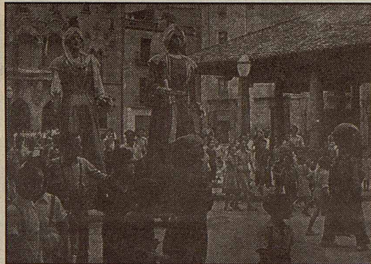
Els gegants moros, any 1949