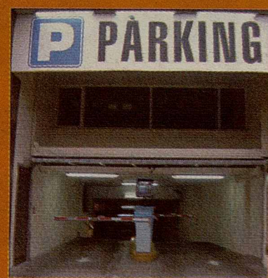
C/ Rafael Casanovas, 36