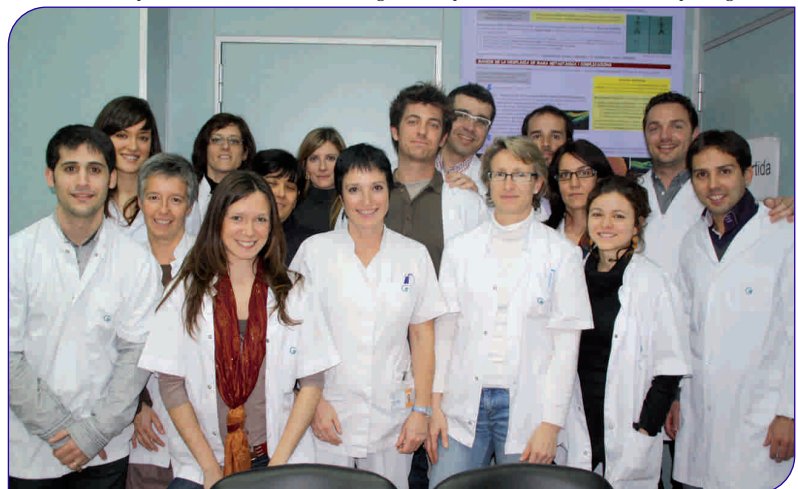
Els professionals del Servei d'Oftalmologia de l'Hospital General de Granollers amb el pòster guardonat