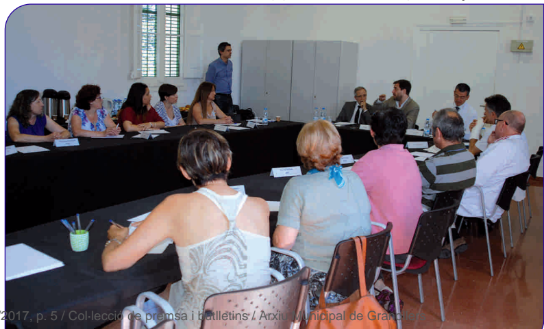
Comín es va reunir amb membres del Patronat, de l'equip directiu, del Comitè d'Empresa i de la junta de directores