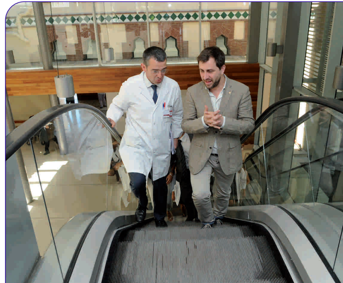
El conseller de Salut, Antoni Comín, al costat del director de l'Hospital