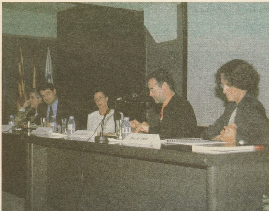
I Jornada Oberta d'Oncologia: Hospital i Atenció Primària.