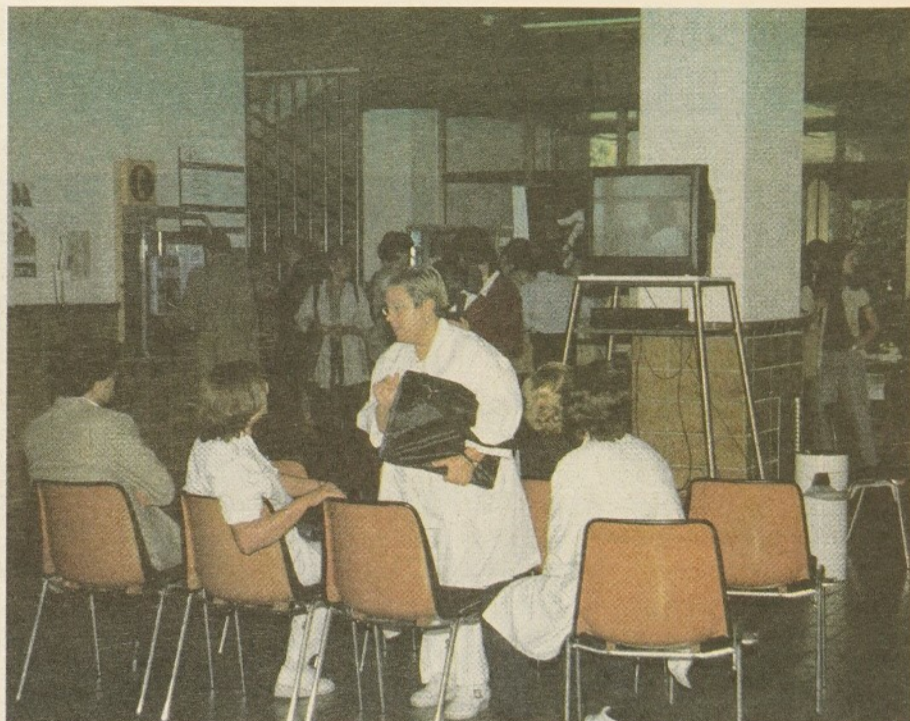
Trobada d'Hospitals Comarcals sobre la Sida.

gació i hospitals comarcals, VIH i infermeria, nous fàrmacs...).