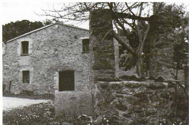
Cal Ranxero amb el pou i el llevant.