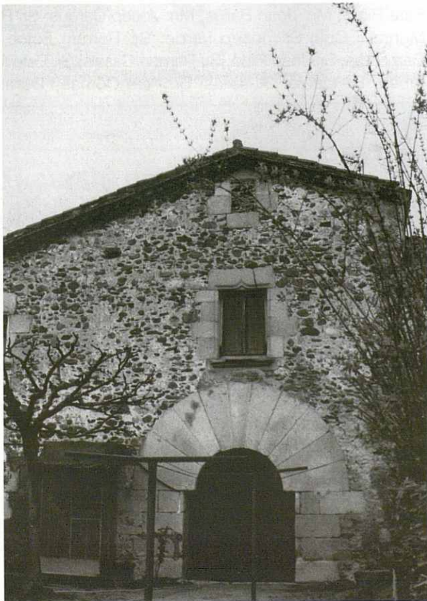
La casa del Rifà amb el portal adovellat i les finestres.

Agafem la carretera de Cànoves a Vilamajor, passem per davant de Can Lari que manté el nom de l'antiga masia, tot i que l'han feta tota nova, Can Feu xic, també està reconstruïda, baixem fins a Can Tomàs Toni, manté una part de l'antiga masia on actualment hi ha corral i, a sobre, aprofitant el desnivell del marge s'hi ha construït una part nova. Després trobem, Can Feu Gros. Fins ara hem vist masies on s'hi viu i es treballa de la terra, de la ramaderia i fins i tot de la restauració, és a dir que és una zona de treball mixt, ha reconvergit el treball agrari i ha mantingut les cases com a habitatge habitual.