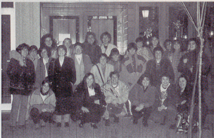
Les dones unides "jamás serán vencidas"!! (Sopar de dones)

-El local. Com tots sabem, el local juga un paper clau en l'evolució d'una colla. El callu que pot donar un local amb bar i futbolín és insubstituïble. Ara bé, com que nosaltres el tema del local no el portem massa bé, és important tenir una mica de