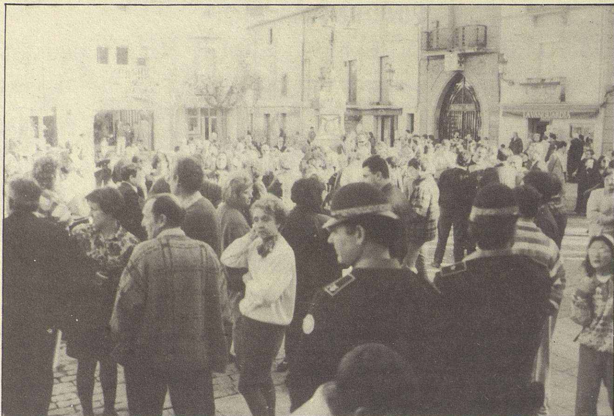
La Federación de Comerciantes está luchando por sus intereses

A pesar del contratiempo inicial, la celebración siguió el día 5 con una fiesta, celebrada en Can Prat, en la que, a parte de cenar y bailar, también se repartieron premios y diplomas. Los diplomas fueron entregados a todos