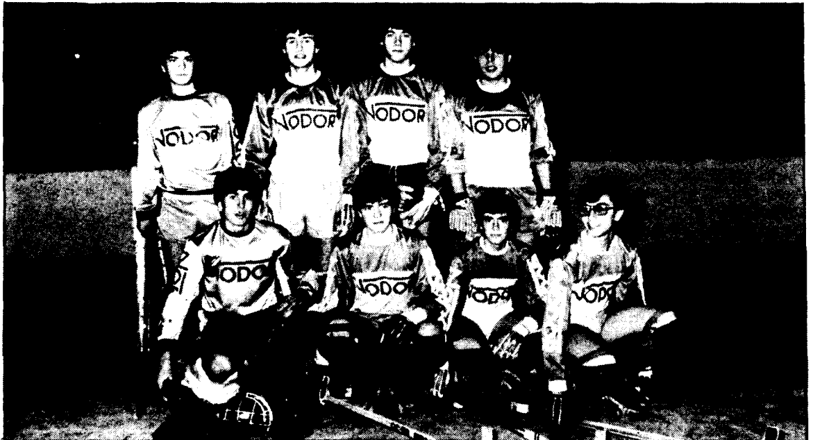
La Garriga (juvenil)