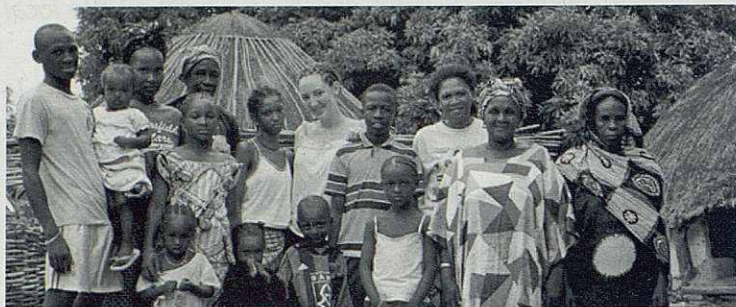
Gran família senegalesa amb una visitant.

Converteix-te i creu en l'Evangelí. Ens diu el prevere en la imposició de la Cendra i no hi ha conversió a l'Evangelí que no passi per la conversió al germà que ens necessita, el pobre. Estem centrats en nosaltres mateixos i ens sembla que els altres són els de més a més, com si nosaltres fóssim els protagonistes i la resta del món fossin els comparses. Potser aquestes dades relatives a la població del món ens poden fer adonar que els habitants del món, tots plegats, no som més que una família nombrosa.