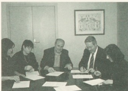
Un moment de l'acte de signatura de l'acord.

El 25 de març passat es van reunir la Direcció i el Comitè d'Empresa de la Fundació Hospital/Asil de Granollers per tal de signar l'acord mitjançant el qual es vol incrementar l'estabilitat laboral al nostre centre.