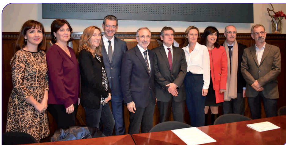
Un moment de l'acte de signatura de l'acord que farà possible la construcció i posada en marxa d'un centre de radioteràpia a Granollers

l'Ajuntament de Granollers i el Consorci Hospital Clínic de Barcelona (HCB), tot i que totes les parts treballaran de forma conjunta per implicar altres actors que facin viable econòmicament el projecte.