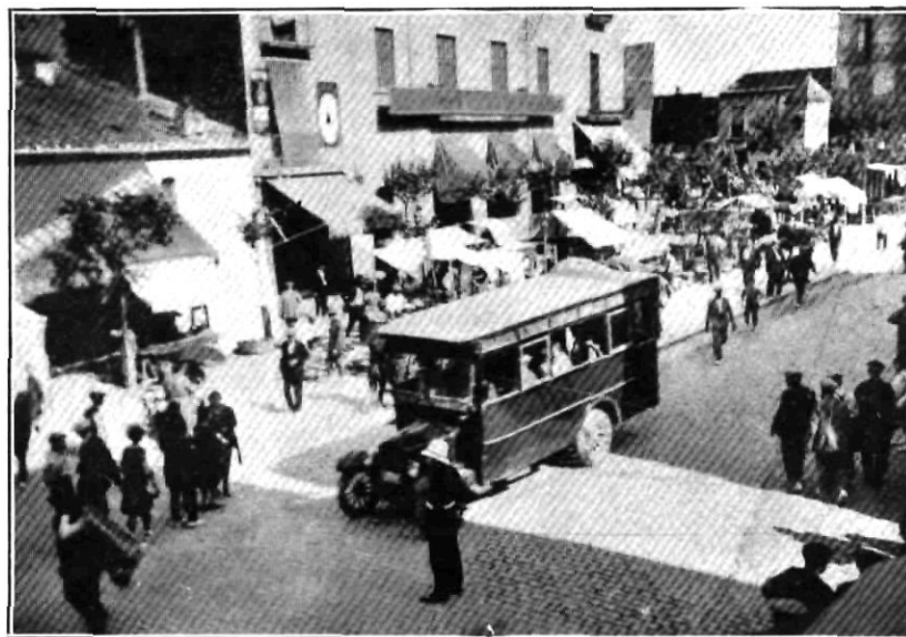
El dijous, a la una de la tarda, el guàrdia urbà de torn a la Plaça del Bestiar ja respira