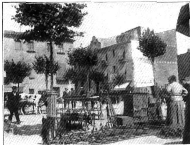
Un establiment de «ferreteria»