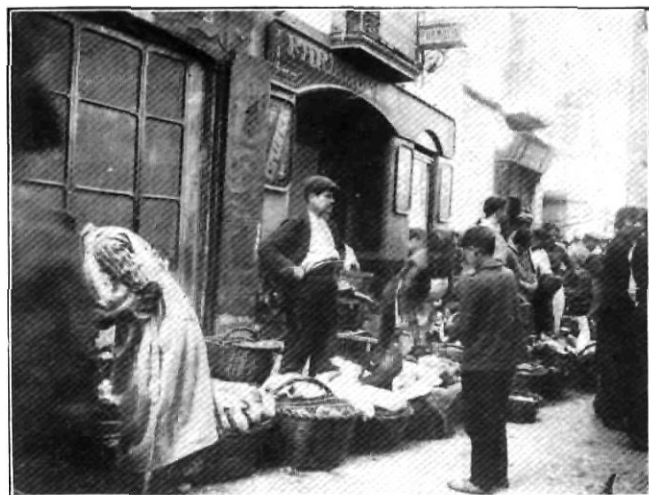
El «rengle» a la placeta de l'Oli