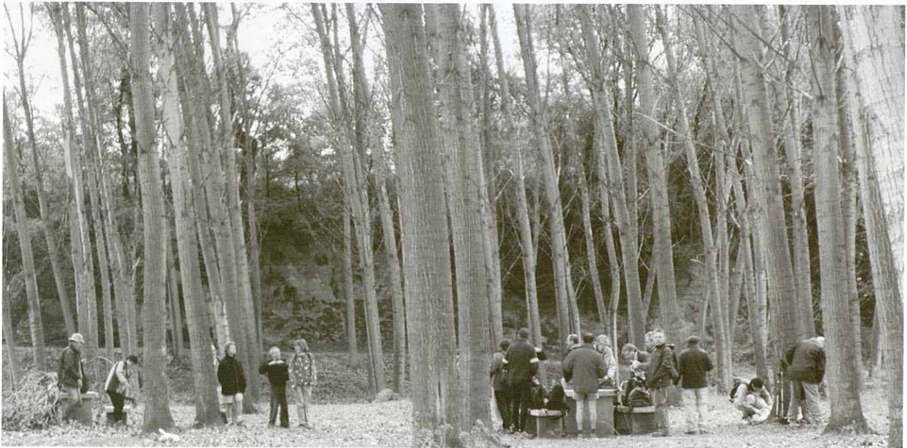
Verneda després de passar la Colònia Gallifa