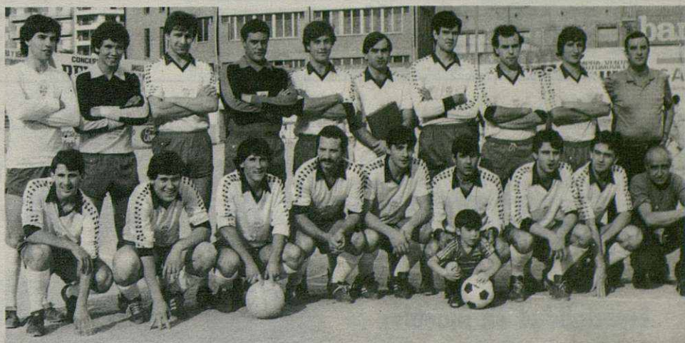
UNA RECIENTE FORMACION DEL GRANOLLERS