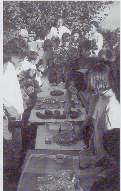
Dos moments entranyables de la pixapinada: el concurs del més pixapí i el concurs de pastissos.

que a partir d'avui tots fem el primer pas amb la nostra actitud de responsabilitat cap a la colla que som i que volem ser, amb l'únic objectiu de gaudir més i millor del fet de pertànyer als XICS DE GRANOLLERS.