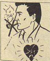
DEJAR DE FUMAR