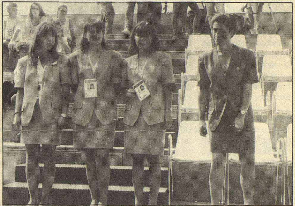
Los voluntarios olímpicos tuvieron un comportamiento ejemplar.