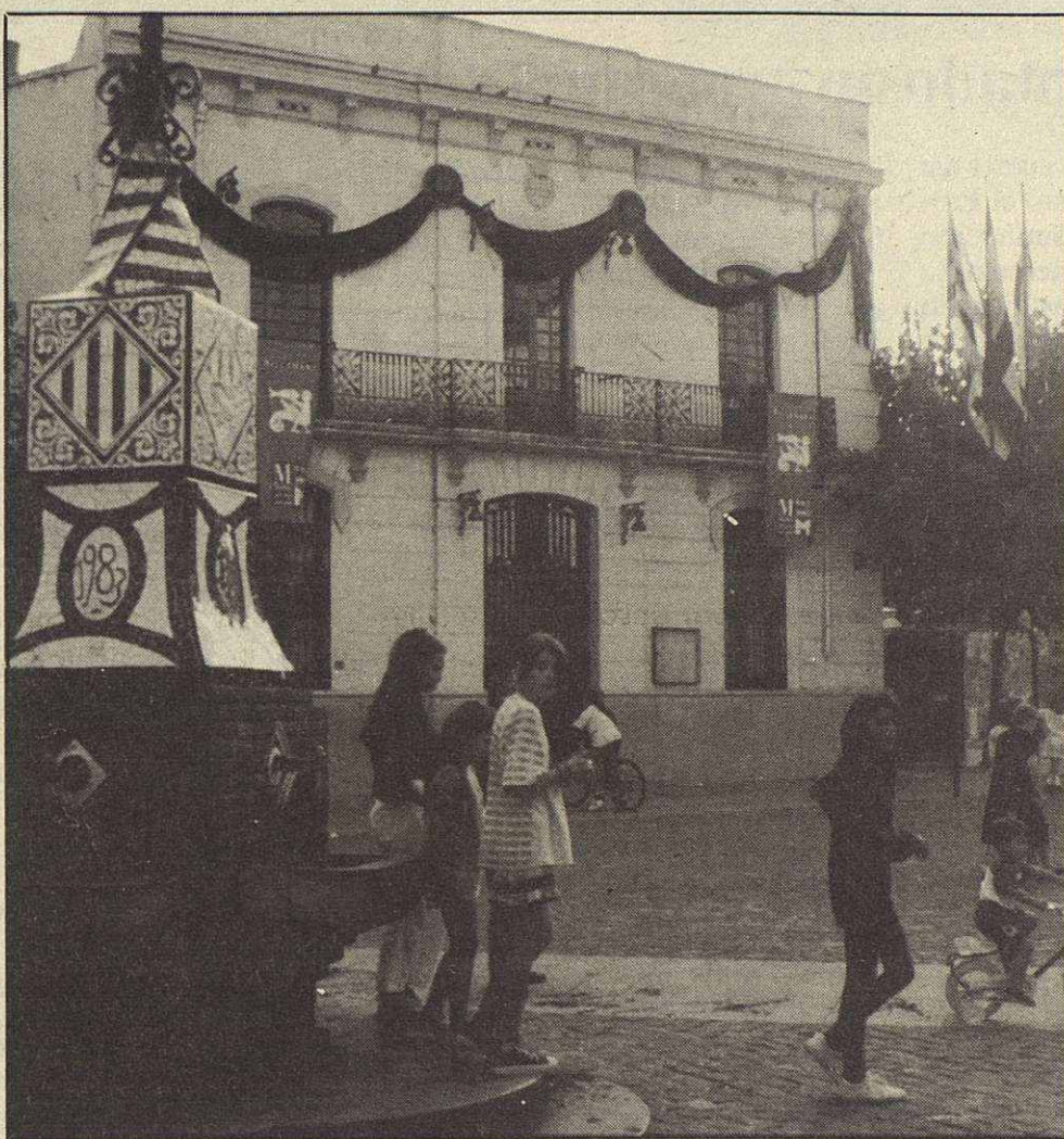
El govern socialista tindria que dialogar més amb els altres partits que representen al poble de Mollet

potència, no és la que ni ara ni mai ha seguit la Senyora Alcaldessa i el seu Equip de Govern, i això ha portat en les darreres setmanes als lamentables conflictes que han envoltat als Col·legis Nous (Divino Maestro). En aquest afer els pares dels nens afectats han patit la incomprensió d'una alcaldessa absolutista que no accepta més proposta que la seva, d'una regidora d'Ensenyament que ha demostrat una total imprevisió de les seves responsabilitats.