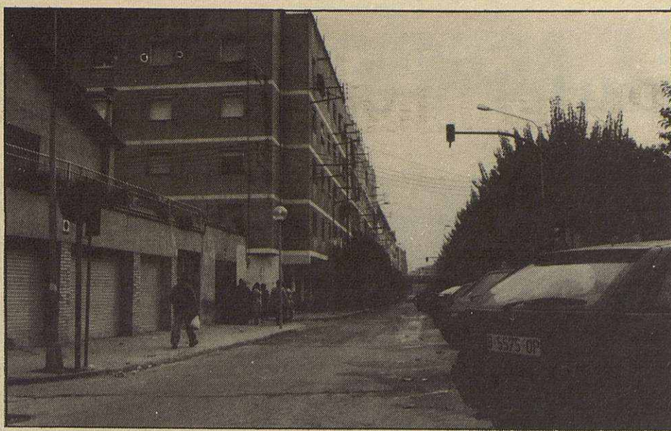
Las ayudas de la Generalitat pueden poner fin a unas interminables reivindicaciones

El presidente de la Asociación de Vecinos de Plana Lledó está satisfecho por este tra-