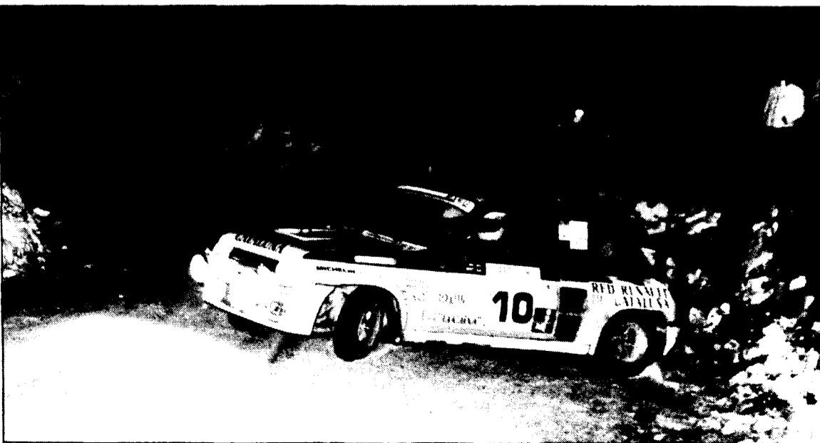
Pons-Autet, han de guanyar