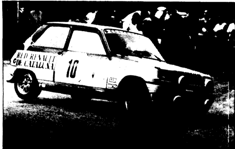
Frigola, actual líder