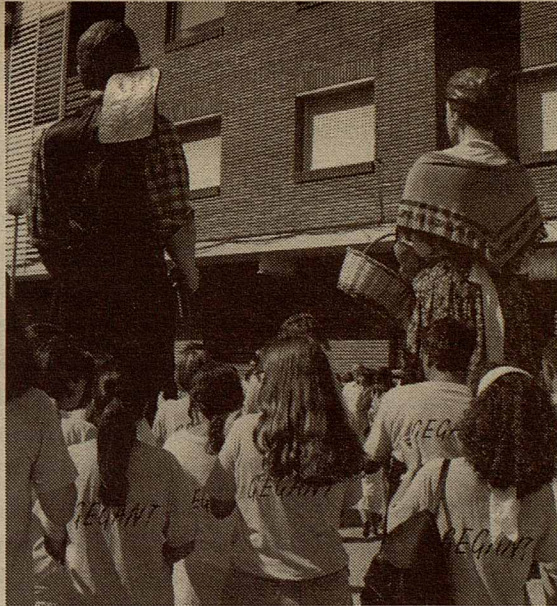
Els gegants de Vilanova del Vallès

Els Grocs i el Verds els Grocs i el Verds els Grocs i el Verds els Grocs i el Verds