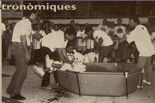
La garrinada és una de les competicions

A més, les colles tenen una subvenció per muntar les seves activitats ■