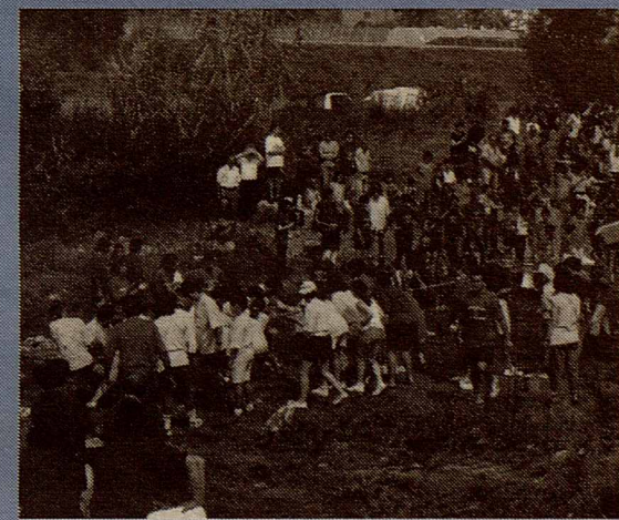
L'estirada de corda al Tenes

Aquí, el fil conductor també són els colors, els groc, el verd, el blau i el vermell del parxís. Les proves amb què competeixen són esportives, culturals i artístiques.