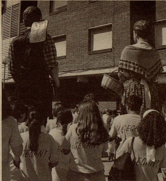
Els gegants de Vilanova del Vallès

Els Grocs i el Verds els Grocs i el Verds els Grocs i el Verds els Grocs i el Verds