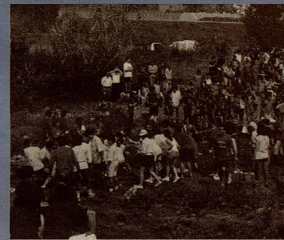
L'estirada de corda al Tenes

Aquí, el fil conductor també són els colors, els groc, el verd, el blau i el vermell del parxís. Les proves amb què competeixen són esportives, culturals i artístiques.