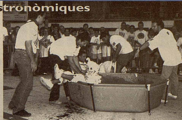
La garrinada és una de les competicions

A més, les colles tenen una subvenció per muntar les seves activitats ■