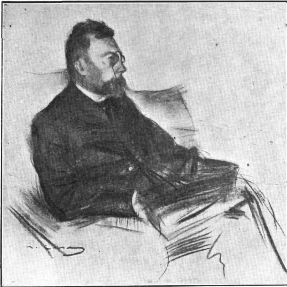
ANGEL GUIMERÀ.—L'immortal dramaturg, a qui el Casino, tal com tot Catalunya, va retre homenatge l'any 1909