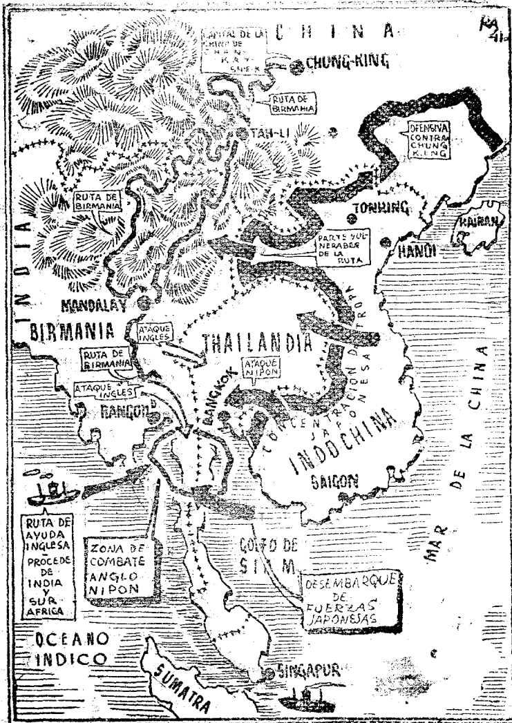
(Mapa archivo «Solidaridad Nacional»)

Tal es un balance superficial de los éxitos japoneses en los ataques relámpago de estos primeros días de lucha en el Océano Pacífico.