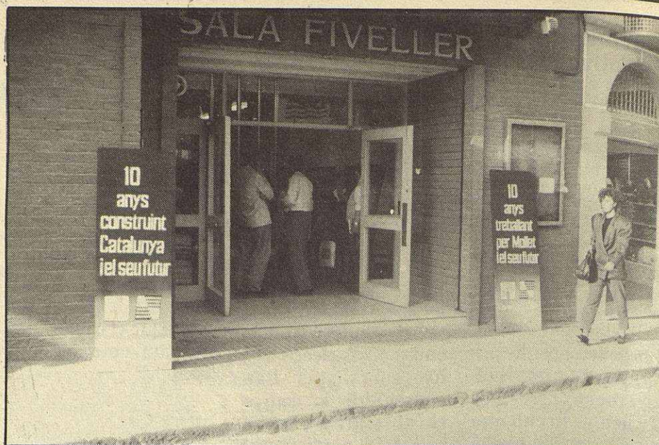
Imágenes que ya son historia