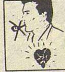
DEJAR DE FUMAR