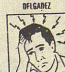
JAQUECA - MAREOS