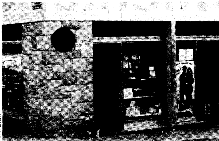
El supermercat atracat a l'Ametlla