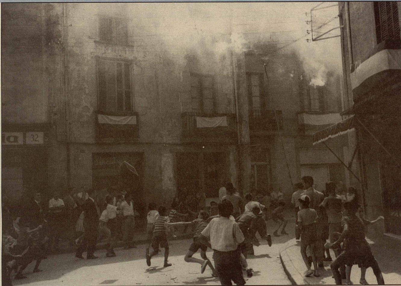
Festa Major 1956 - 1957. Plaça Porxada cantonada pl. Manel Montanyà, traca amb pluja de joguines

El mateix destaca algunes de les orquestres que havien tocat a Granollers: "La Maravella, Florida, Selecció -de Granollers