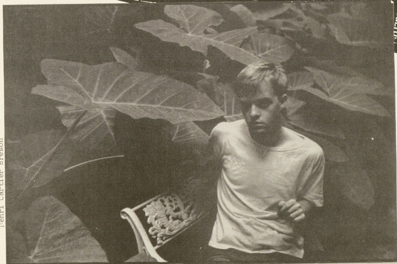
Henri Cartier Bresson