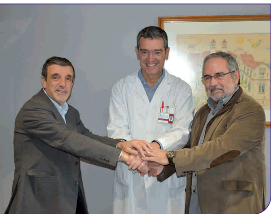
La musicoteràpia també s'ha implantat a la Unitat de Cures Intensives

Serveis Funeraris Cabré Junqueras, la Fundació Privada Hospital Asil de Granollers i l'Associació Art Solidari van signar a finals de novembre un conveni de col·laboració per tal de desenvolupar