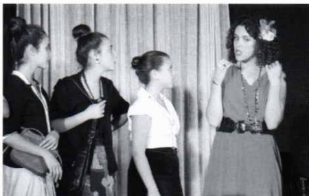
L'Inspector, representat pel Jove TNT.

Per tot això diem que ha estat un bon any. Tenim 40 persones fent teatre i els nostres muntatges, els han vist 1.000 espectadors a Santa Eulàlia. Aquest volum de gent i creacions ens omple d'esperança vers el futur del teatre amateur al nostre poble i ens fa pensar que aquest 2014 seguirem amb els mateixos nivells de producció teatral.