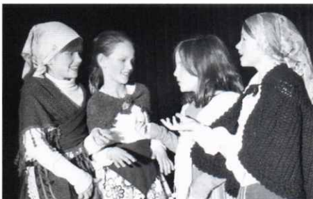
Any de neu any de Déu, representat pel TNT Petit.

I queden els "The Mamas and the Papas", que en definitiva són les mares i pares dels nens del TNT Petit que, vist l'èxit dels seus fills, també van decidir crear un grup i fer te-