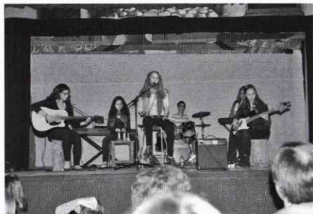
Da Capo en el festival en benefici de Càritas.

El diumenge 25 de març es va fer un concert en benefici de Càritas organitzat pels joves artistes de l'escola de música "Da Capo" que ens van fer gaudir amb les seves cançons i peces musicals. També hi va participar el grup de teatre infantil del Casal amb la representació de dos contes: "L'abecedari so-