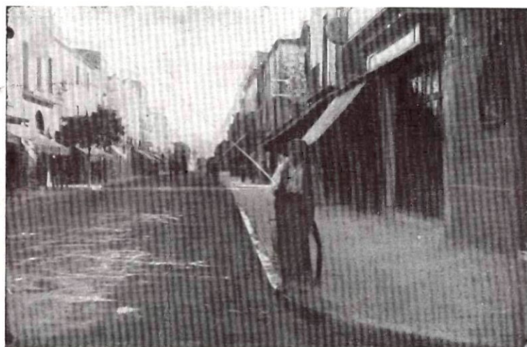
L'HOMME DE LA MANGUERA