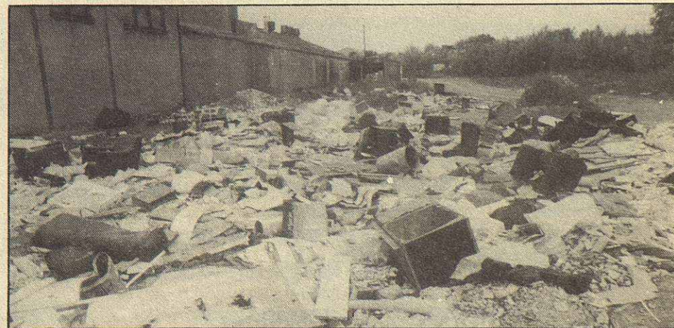
Deixalles de tot tipus al costat de la carretera de Sabadell a l'alçada del número 73 de l'Avinguda Rafael Casanoves.