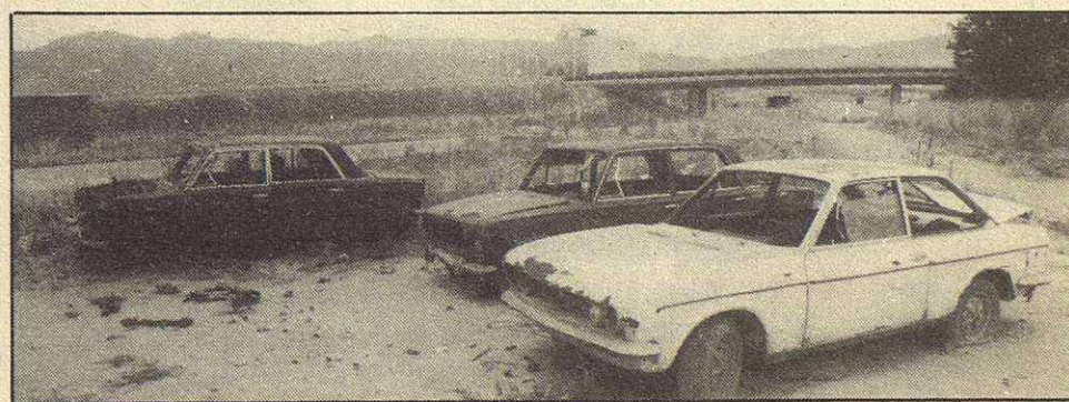
Cotxes abandonats al costat de la variant N-152, en el terme municipal de Mollet.