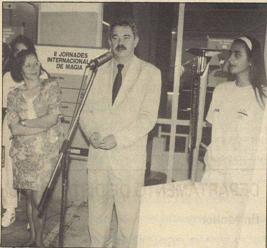
Pasqual Maragall dirigió unas palabras al numeroso público que se congregó en Can Gomà

El Ayuntamiento de Mollet y la Unión de Consumidores de Catalunya firmaron un convenio el pasado día 23, por el cual la Unión de Consumidores tendrá una oficina permanente en nuestra población.