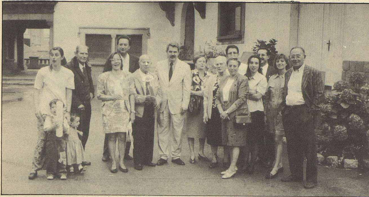
Pasqual Maragall posando con un grupo de simpáticos asistentes

en todo momento por las autoridades locales, visitó de forma breve las instalaciones olímpicas, que acogerán las pruebas de tiro a partir del próximo día 26 de julio.