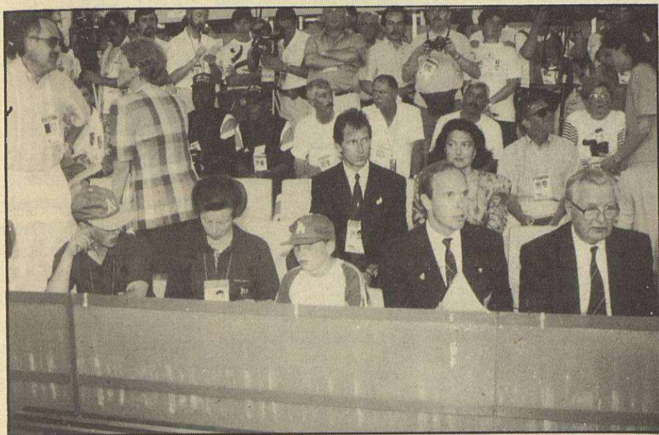
La primera final tuvo dos testigos de excepción: Ana de Inglaterra y Alberto de Mónaco