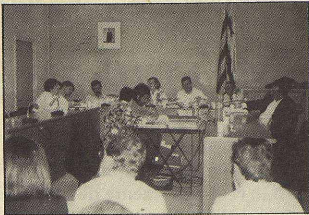
El gobierno socialista se quedó solo.