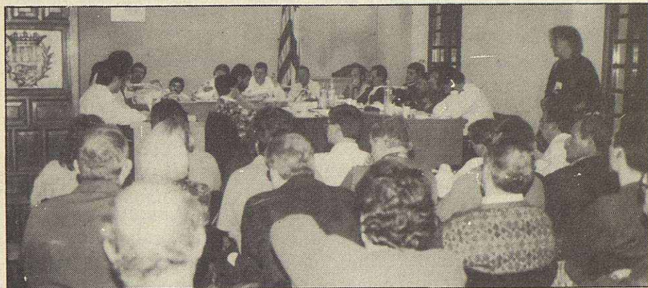
La Sala de Plenos no admitió más personas.