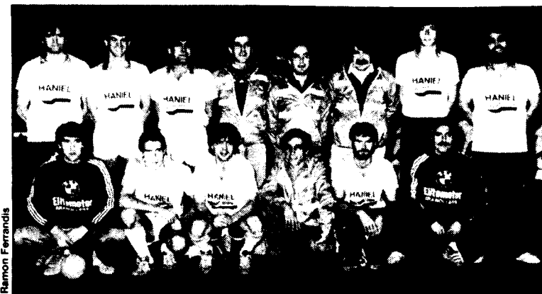
L'Equip Haniel no para

últim, Flaqué, sembla que ja li ha agafat el ritme a la categoria i en els últims encontres està essent un dels destacats, oferint tot el bon futbol del que ell és capaç tal i com ja havia demostrat quan jugava en els juvenils. El segon gol visitant, que deixà el marcador un xic ajustat, va ésser aconseguit en els últims moments, mercès a un penal assenyalat per l'àrbitre de torn, senyor Carretero que, en general, va tenir una bona actuació. El proper partit que disputarà el Canovelles el dia 1 de gener no és pas un compromís fàcil, doncs ha de visitar el camp del Mataró, un equip que com el vallesà tracta de recuperar la categoria perduda la temporada passada. L. E.