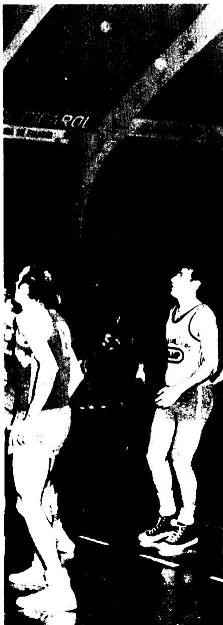
asta del Helios ún momento