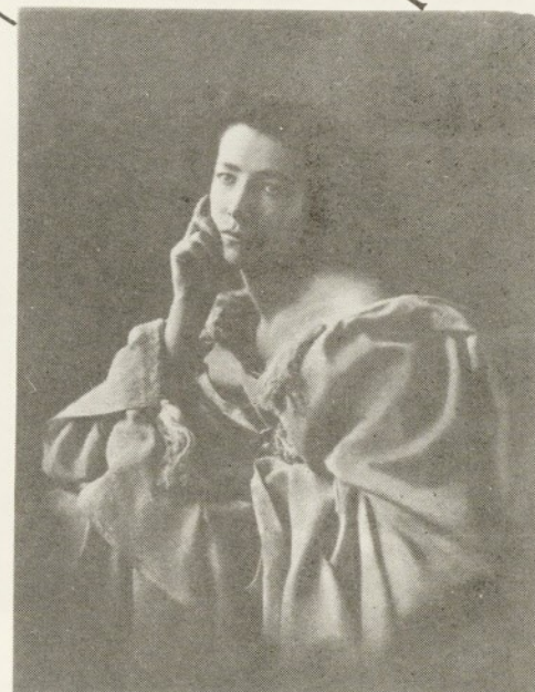
* 10.- Nadar Sarah Bernhardt 1859