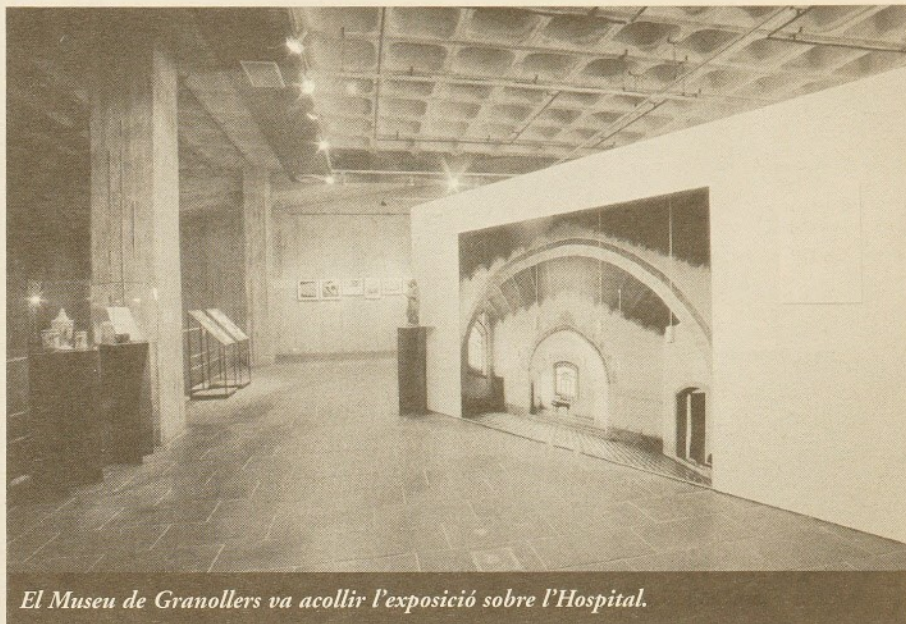
El Museu de Granollers va acollir l'exposició sobre l'Hospital.