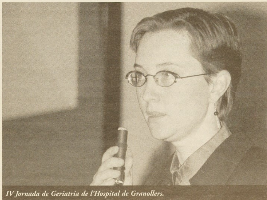
IV Jornada de Geriatria de l'Hospital de Granollers.

Aquests espais repassaven la història de la institució i anaven acompanyats d'un darrer àmbit, dedicat a l'Hospital actual, que mostrava una part del treball que diversos fotògrafs de la comarca han fet sobre l'Hospital durant els darrers mesos. Les fotografies de Pere Cornellas, Ramon Ferrandis, Josep García, Dolors