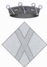
El nou escut municipal.

El Ministeri d'Educació premia un projecte de millora de la biblioteca de l'IES La Vall del Tenes. L'IES la Vall del Tenes comença els actes de celebració del seu 25è aniversari.