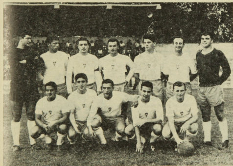
Equipo del C. D. Granollers, que venció brillantemente en Olot

Granollers, 16 de setiembre de 1964 — Añ3 1 : Núm. 6 - Dep. Leg. B-22.011 -1964 — Precio del ejemplar: 5 pesetas