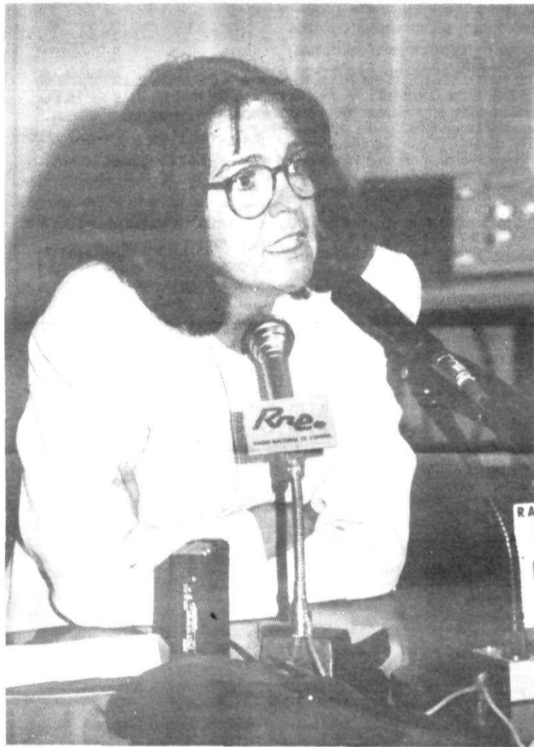
Rosa Conde durant la seva intervenció a "La Marineta" de Mollet