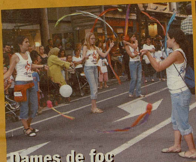
Dames de foc