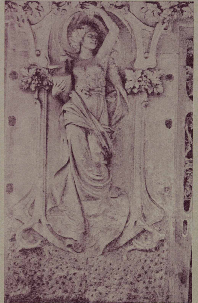
Detall façana - Can Blanxart - Avda. Joan Prim, 11